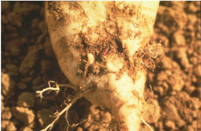
Зелкова мува - ларва ( Delia radicum )