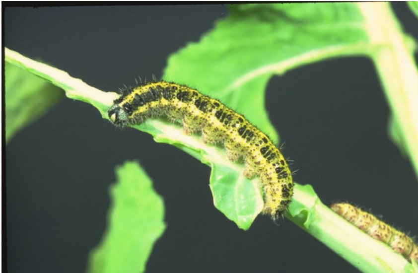
Голем зелкар-ларва ( Pieris brassicae )