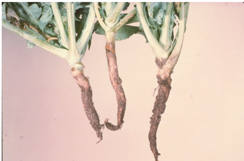
Зелкова мува-ларва, штети ( Delia radicum )