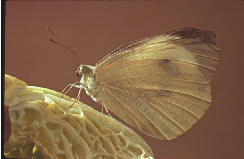
Голем зелкар ( Pieris brassicae )