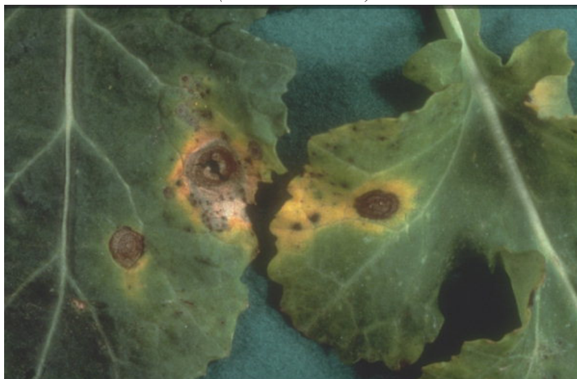
Кафеава-црна дамкавост ( Alternaria brassicae )