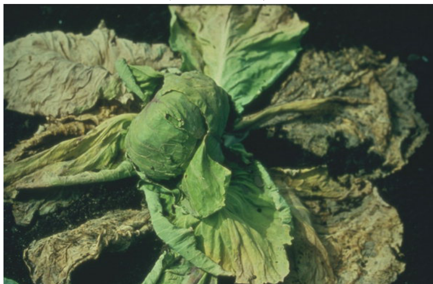
Зелкова мува, штети ( Delia radicum )