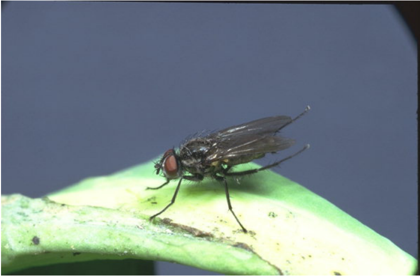
Зелкова мува ( Delia radicum )