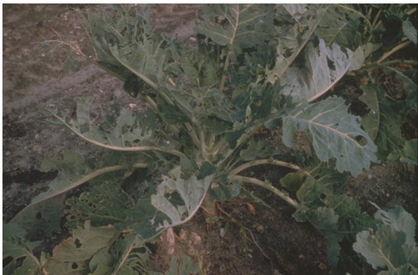
Голем зелкар - штети ( Pieris brassicae )