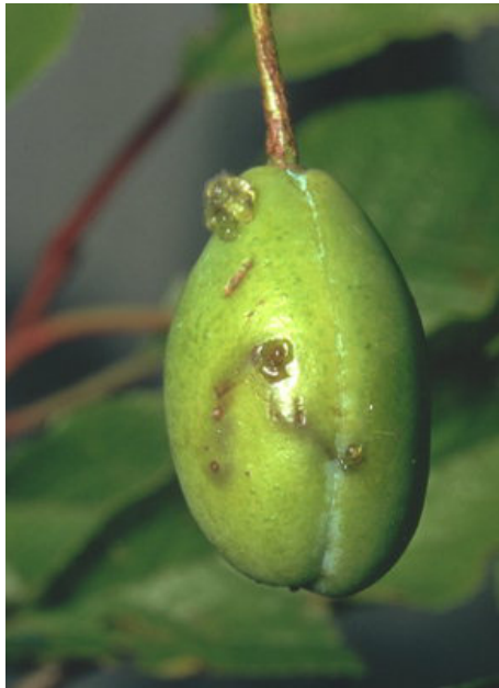
Штети на плод Сливов црв ( Cydia funebrana )