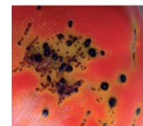
Дамкавост на плод