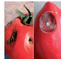
Сиво и бело гниење