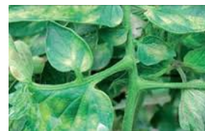
Пламеница (Phytophthora capsici)